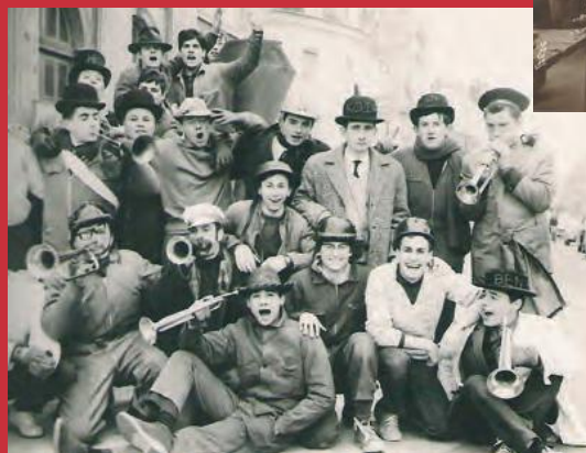
Bal en 1964