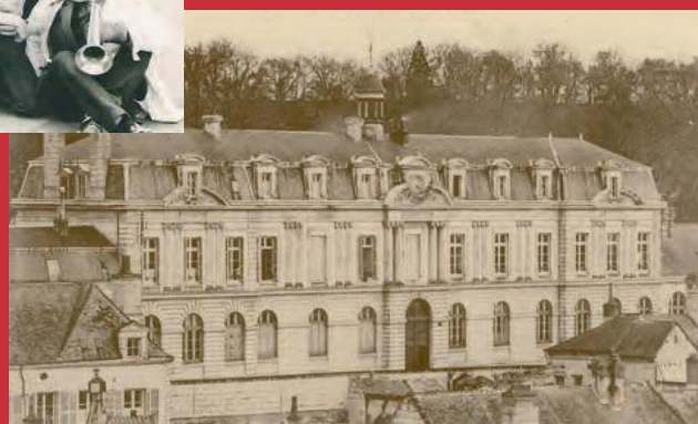
École industrielle de Saumur, au sein du collège des garçons, rue Duruy (AMS-25F0639)